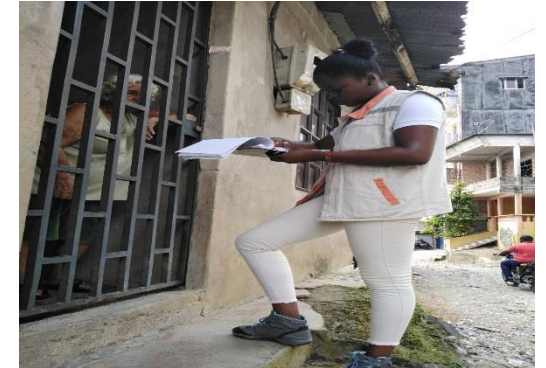
Jornada de identificación de usuarios con acometidas en los barrios Jardín la 18.