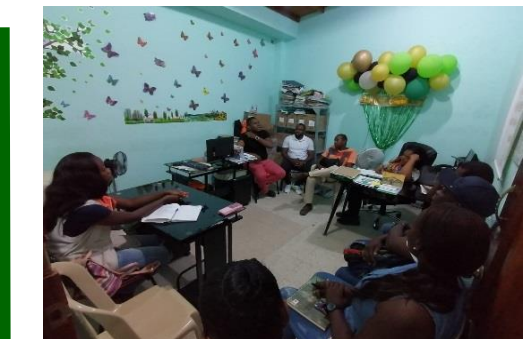
Participación en reunión en la secretaria de inclusión, con los lideres de los barrios Fuego Verde y el Caraño.