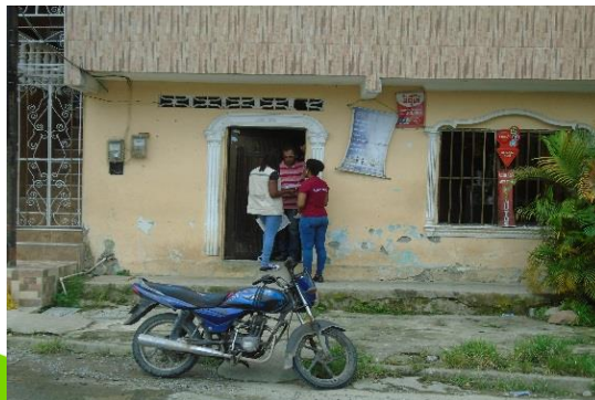
Sensibilización a los habitantes del barrio J Sensibilización a los habitantes del barrio la Esmeralda, sobre uso racional y eficiente del agua

Apoyo a una (1) visita guiada con docentes de la Institución Educativa Santo Domingo de Guzmán, para que conozcan el proceso de captación y potabilización del agua. Participaron (49) personas.