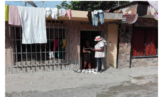
Entrega de convocatoria a reunión a los habitantes del barrio la Paz, para tratar temas asociados el servicio de acueducto..