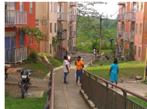
Socialización de información a través de perifoneo a los habitantes de Ciudadela MIA, sobre manejo adecuado de residuos solidos.