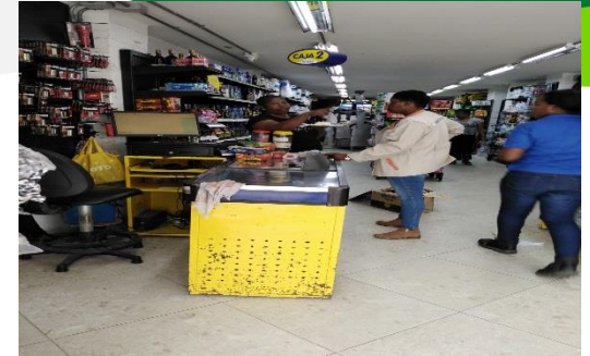
Sensibilización en el supermercado Mercames, sobre manejo adecuado de residuos sólidos.

Dos (2) jornadas de convocatoria a reunión, a través de entrega de volantes, a los habitantes de los barrios Jardín sector Heliconias 2 y la Paz, para que participen en la reunión de cierre de obras de optimización del servicio de acueducto, socialización de satisfacciones o inquietudes.