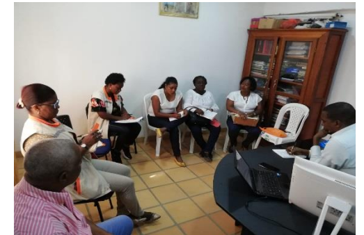
Reunión de socialización de información a docentes de la Institución Educativa Santo Domingo de Guzmán.