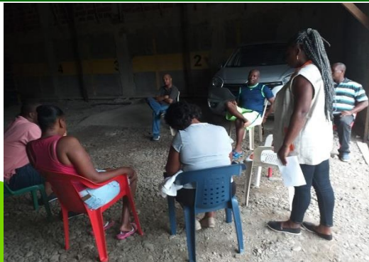
Socialización de información a los habitantes del barrio Jardín sector Heliconias 2, sobre cierres de obras de optimización del servicio de acueducto.

Una (1) capacitación al personal docente del Centro Educativo Seed Of Love, sobre uso racional y eficiente del agua.