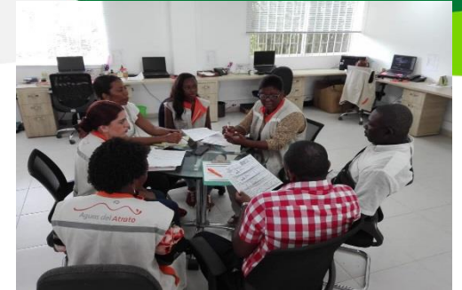
Reunión de socialización a ediles de la comuna 2.

Participación en reunión para socialización de trabajos del proyecto de alcantarillado en la zona centro. Participaron (7) personas.