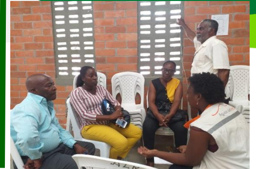
Reunión de socialización a los docentes del área de ciencias naturales y educación ambiental de la Institución Armando Luna Roa.

Participación en una (1) reunión en la secretaria de inclusión, con los lideres de los barrios Fuego Verde y El Caraño, para tratar temas de seguridad y trabajos de revisión. Participaron (9) personas.