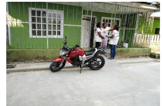
Entrega de presupuestos en el barrios Monterrey.