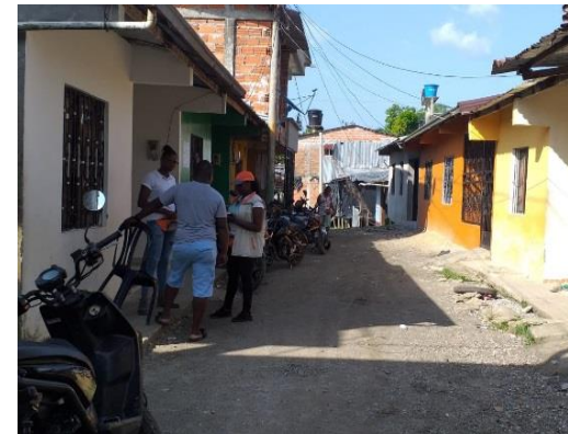
Sensibilización a los habitantes del barrio las Terrazas, sobre manejo adecuado de residuos sólidos.