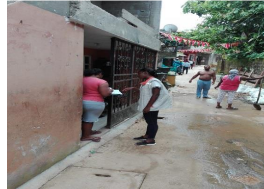
Jornada de levantamiento de información para el proceso de vinculación de clientes al servicio de acueducto.

Siete (7) jornadas de sensibilización dirigida a habitantes de los barrios: las Terrazas, los Castillos, Obapo, las Palmas, Simón Bolívar, Horizonte, la Playita y la Cazcorva sector 17 de Octubre, sobre manejo adecuado de residuos sólidos, horarios de recolección, servicios de recolección especial y la importancia de no arrojar residuos a los río. Se impactaron (369) personas.