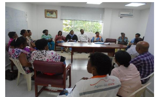
Reunión de socialización de información con rectores y docentes de los Clubes Defensores del Agua.