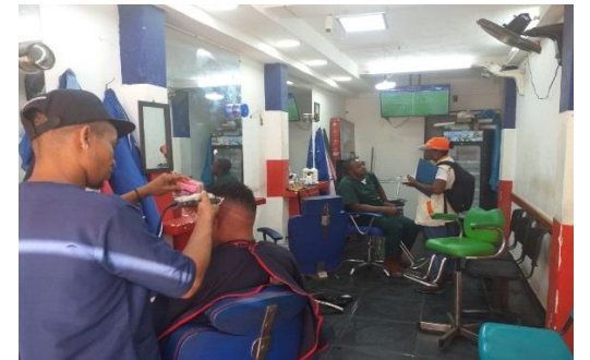
Sensibilización en peluquerías sobre manejo adecuado de residuos peligrosos.