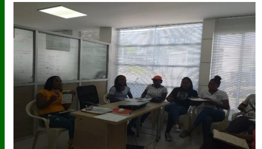
Capacitación al equipo de gestión social, con la fundación MIMA.